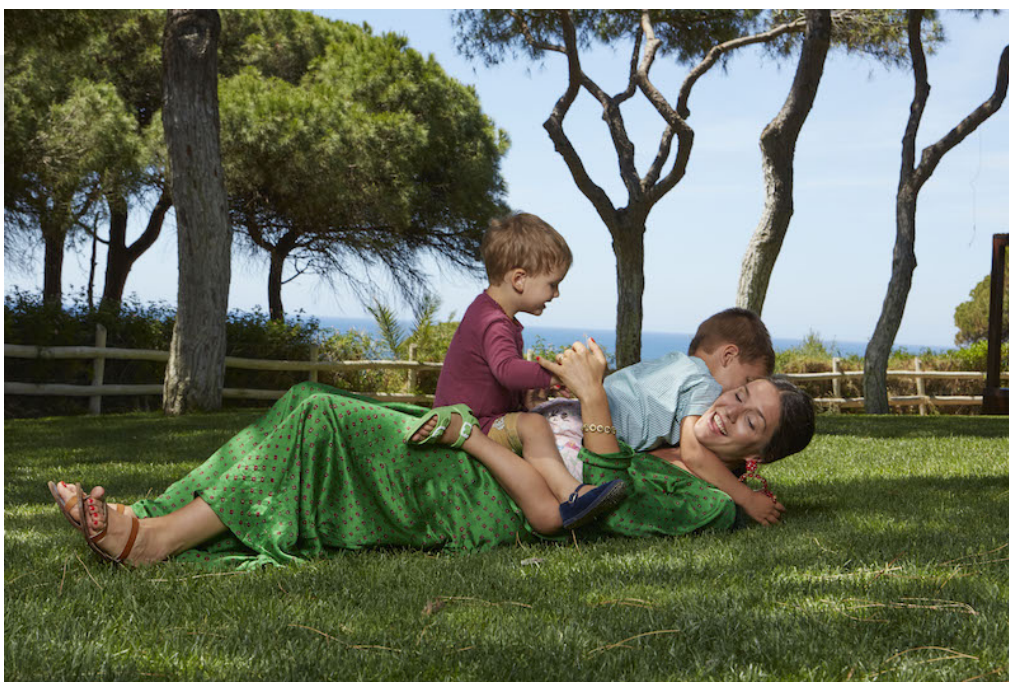
На фото: Маргерита Миссони с сыновьями

Маргерита идет по стопам матери, точно нельзя назвать голословным.